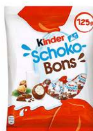
Kinder Schoko-Bons 125 g - paczka