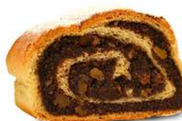
Strucla z makiem 50 g - kawałek