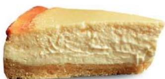
Sernik 120 g - kawałek