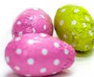
Jajeczko czekoladowe 5 g - sztuka