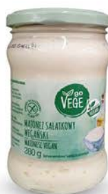
Majonez wegański 25 g - łyżka