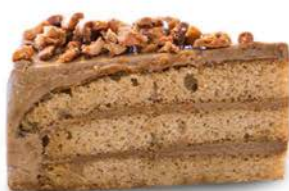
Orzechowiec 85 g - kawałek