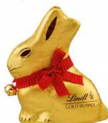
Zajaczek czekoladowy 100 g - sztuka