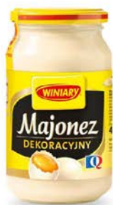
Majonez 25 g - łyżka