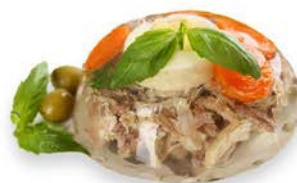
Galaretka z kurczakiem 100 g - sztuka