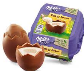
Jajko czekoladowe z kremem 35 g - sztuka