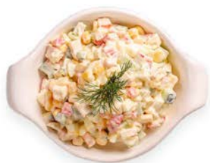
Salatka jarzynowa 25 g - łyżka